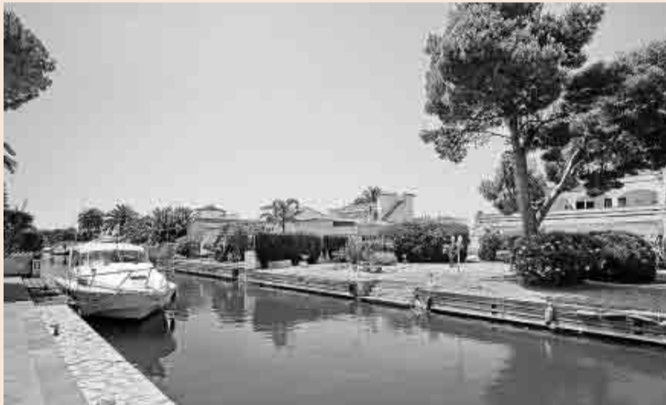
Vista de Empuriabrava, urbanización situada en el municipio de Castelló d'Empúries (Alt Empordà).

El listado continúa con Castell-Platja d'Aro (Baix Empordà) en sexta posición. Aparecen luego Vilafranca del Penedès, Palafrugell (Baix Empordà), Salou (Tarragonès) y Torroella de Montgrí (Baix Empordà), donde se ubica un núcleo residencial y turístico muy potente de la Costa Brava: L'Estari.